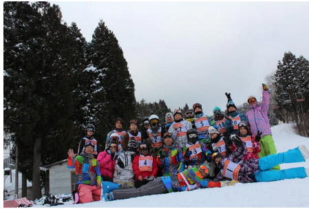
新春ツア（ハイパーポール東鉢）

このように新しい技術は実際には行ったり来たりしながらも常に進化しております。このことはボードにおいても同じことといえるでしょう。我がクラブではスキー・ボードともに優秀な指導者が年末には指導者研修会に参加し、常に最新の技術を勉強・習得して参加者の皆様をお迎えしております。またイベント運営においてもクラブ員皆一生懸命打ち合わせを行い進めております。クラブ員の皆様に感謝いたします。近づきつつある次回の冬のシーズンも是非ご期待していただきたいと思います。皆様と雪上でお会いし楽しく過ごせることを楽しみにしております。