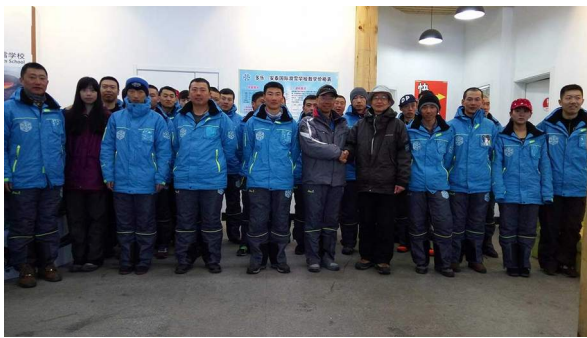
多楽美地滑雪学校のイントラ仲間 大変お世話になりました!

も怖い。それから気を付けないといけないのが顔面の凍傷だ。私も軽い凍傷になった。その時は気づかなかったけど、23日して皮膚が黒っぽくなり、軽いやけどの跡のように皮膚がパリパリになってひと皮むけ、しばらく痕が消えなかった。中国でのスキーでは顔を覆うしつかりしたマスクが必要だ。また、凍傷防止に幅広の絆創膏を頬や鼻に貼っている人もいる。中国のスキー事情だけど、2015年、スキー人口は1250万人、スキー場の数は568か所だそう。2022年に北京冬季オリンピックが開催されるので、スキー業界も今はとても活気にあふれている。そしてその中国で、私は長年の夢だった「中国語で指導できるスノーボーイントラ」(曲がりなりにも)実行でき、とても有意義なシーズンだった。