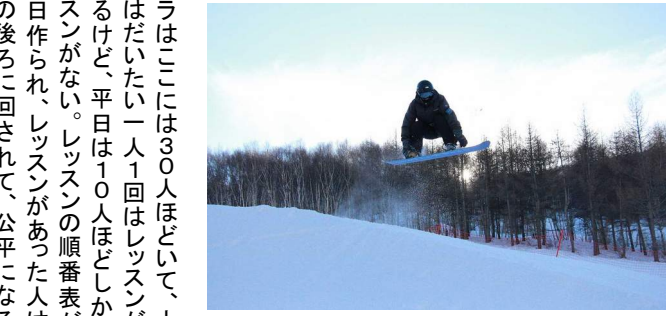
パークでキッカーの練習

イントラは20kmほど離れた崇礼の町に住んでおり、ワンボックスカーで毎朝8時に出勤、17時に退勤する。中国のスキースクールは基本1対1のレッスンのように、何時と何時にレッスンが始まるというようには決まっていない。お客があれば呼び出されて、レッスンを始めるのだ。中国のスキースクールの料金はすごく高い。多楽美地は中堅どころのスキー場で五つ星ではないけど、それでも、1人2時間4200元(約7000円)、1人3時間6200元(約1万円)。