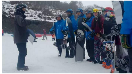
→イントラに講習中

最後に子供の感想。自然の山を下るのは楽しかったけど、スキーでの登りは嫌だとのこと。私も昔はそう思っておりまし